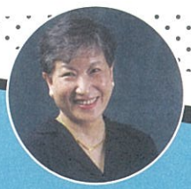
小學生公益行動評審

「改變世界，從小開始！」 孩子的夢想很純粹，而大人的任務就是你有這份純粹，讓他們去試。每個孩子都有一雙翅膀，別讓他們在展翅前就折翼。