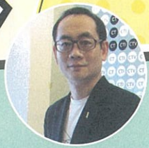
小學生天使軍團教練

或許你會問：為什麼不等他們長大一點、懂事一點再去做公益行動呢？ 答案是：不能等，因為生命不能等，教育也不能等，一蹉跎，生命就流失了，孩子就長大了，機會就失去了。