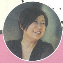
小學生公益行動評審團團長